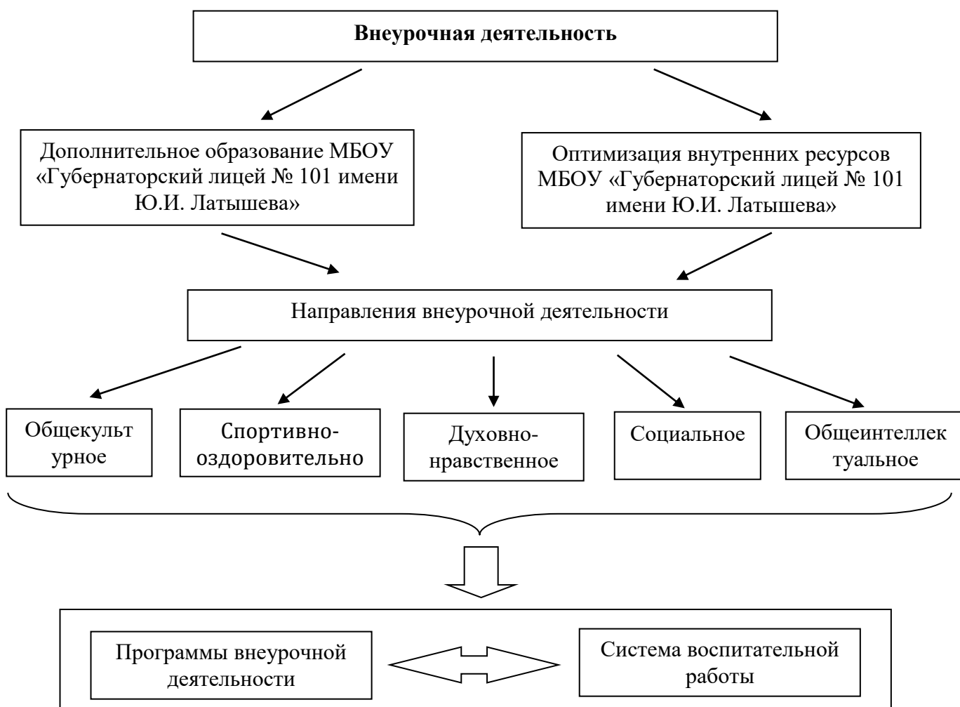
Рис. 1. Модель организации внеурочной деятельности МБОУ «Губернаторский лицей № 101 имени Ю.И. Латышева».

Внеурочная деятельность Лицея предполагает, что в ее реализации принимают участие все педагогические работники. Координирующую роль выполняет классный руководитель, который в соответствии со своими функциями и задачами: